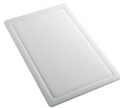
PLANCHE DE DECOUPE HDPE 27x42 CM